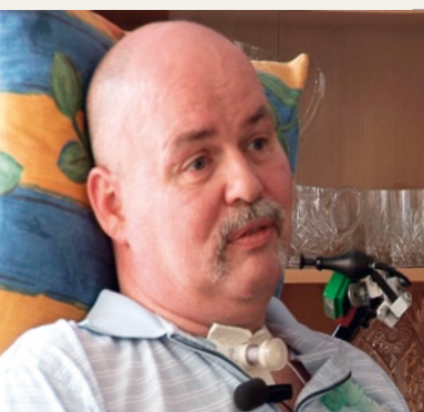
Tommy – Quad Joy Mouse